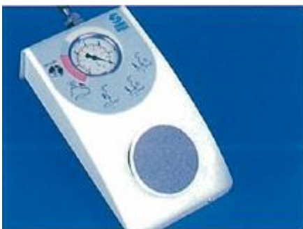
付属品:バキュームポンプ