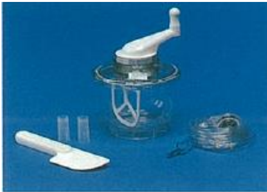
ミキシングシステム