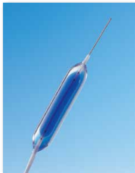
医療機器承認番号：20600BZY00326000 販売名：心臓血管拡張用カテーテル